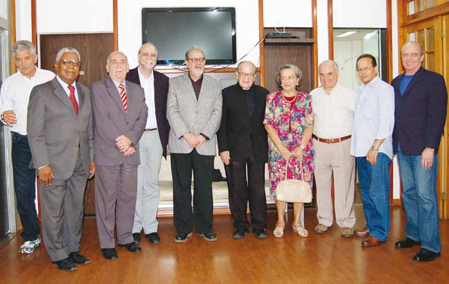
Conselheiros recebem representantes da PUC-Rio e convidados especiais