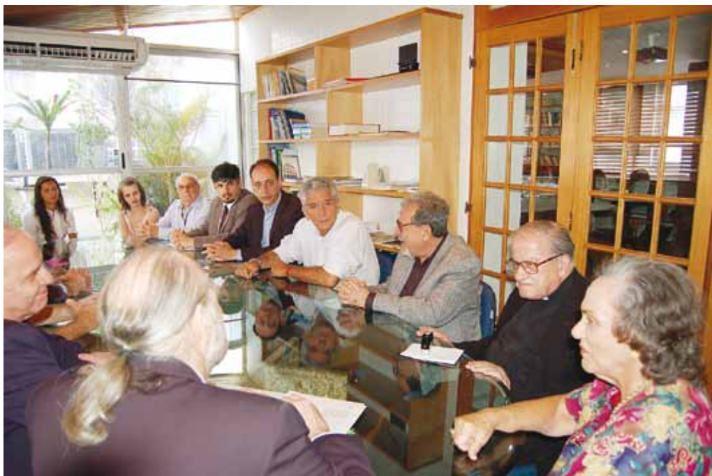
O convênio foi assinado no 7º andar da sede do CRA/RJ, na Tijuca, no Rio de Janeiro