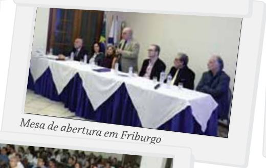
Mesa de abertura em Friburgo