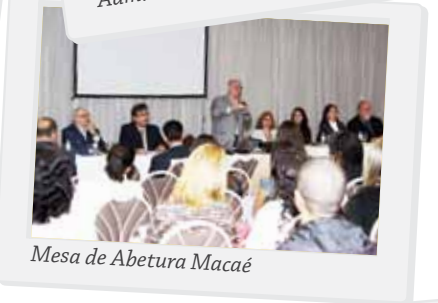
Mesa de Abertura Macaé