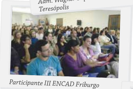
Participante III ENCAD Friburgo