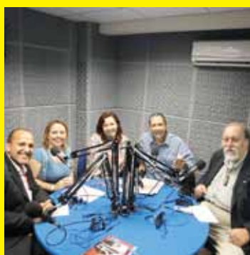
Membros da empresa Simetria, devidamente registrada no CRA/RJ, falam sobre o recrutamento e seleção de pessoas com deficiência, entre outros assuntos