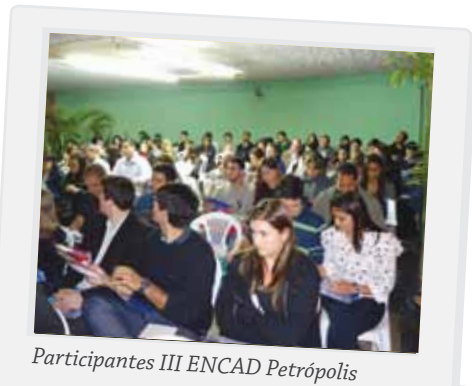
Participantes III ENCAD Petrópolis