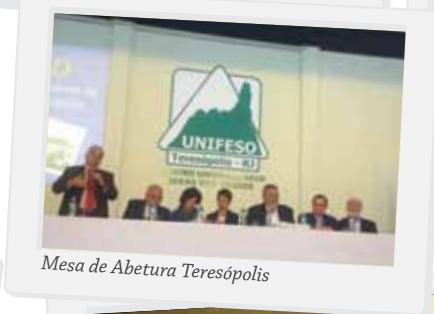
Mesa de Abertura Teresópolis