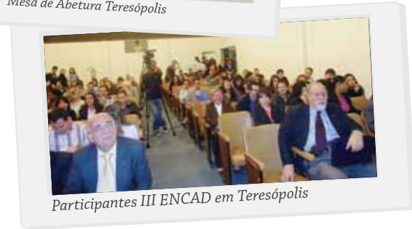
Participantes III ENCAD em Teresópolis